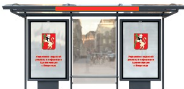
Поз.2. Рекламный навес с параллельным расположением пилона