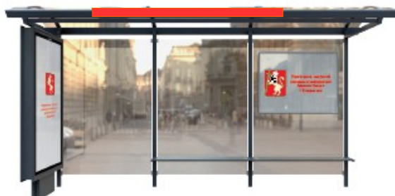
Поз.1. Рекламный навес с перпендикулярным расположением пилона