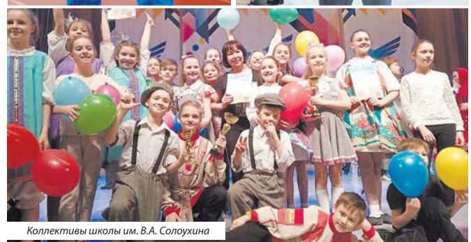
Коллективы школы им. В.А. Солоухина