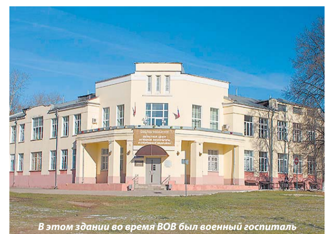
В этом здании во время ВОВ был военный госпиталь

Шансы положительного ответа весьма велики, поэтому депутаты предложили городской и областной администрациям начать разрабатывать программу мероприятий, посвященных сохранению военно-исторического и трудового наследия города, патриотическому воспитанию жителей и молодежи. Также во Владимире планируют установить стелу с изображением герба города и текстом Указа Президента.